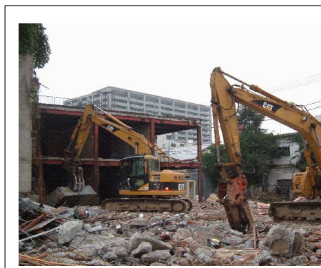
【取り壊される既存建物】

これから平成21年6月末の竣工、秋の 開館に向けて、解体、整地、本体、内装と 3年間をかけた工事が始まります。