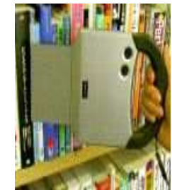
蔵書点検用リーダー

機器の導入に際しましては、不慣れな方への取り扱い説明を行うと共に、職員による対応窓口も設けます。