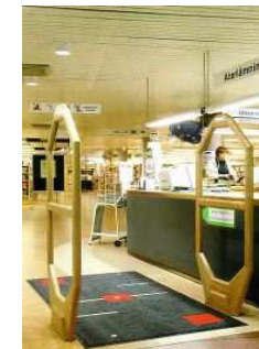
出入り口用ゲート