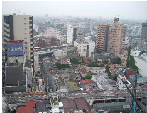
【再開発建設予定地】

長年そこに住んでおられた方々にとっては、さびしい思いもあると思いますが、賑わい のある金町駅前を楽しみにして、新しいビルの誕生を待ちたいと思います。