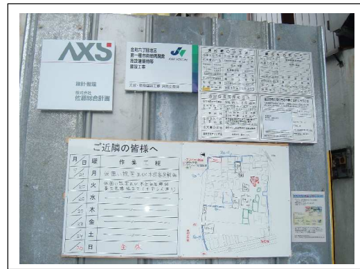
【工事をお知らせする看板】