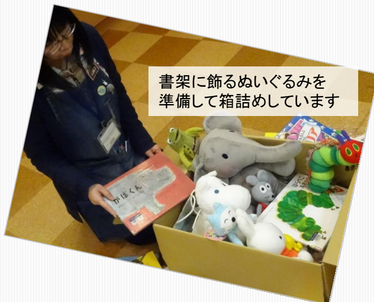
書架に飾るぬいぐるみを準備して箱詰めしています