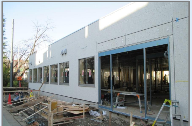
完成に着々と近づく建設工事の様子。(2015年12月撮影)

開館までまだしばらく時間がかかりますが、子どもも大人も使いやすい図書館をつくるために、関係者一同力をあわせて着々と準備を進めております。