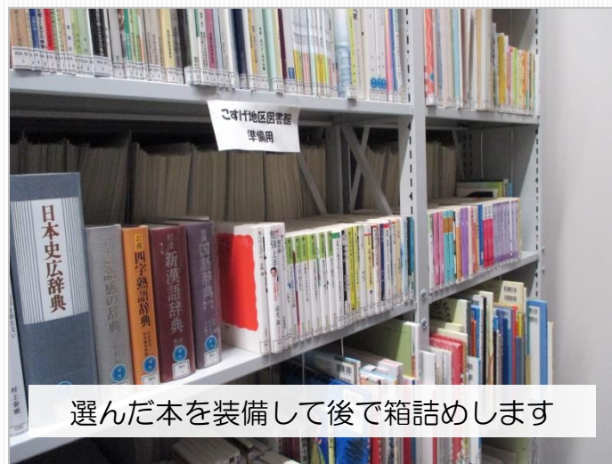
選んだ本を装備して後で箱詰めします