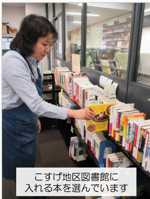
こすげ地区図書館に入る本を選んでいきます