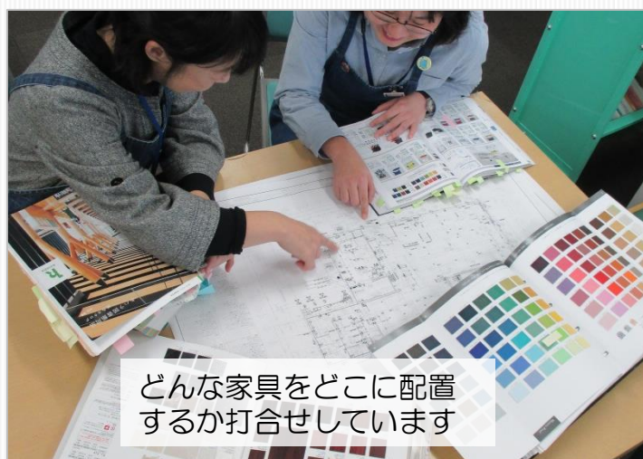
どんな家具をどこに配置するか打合せしています